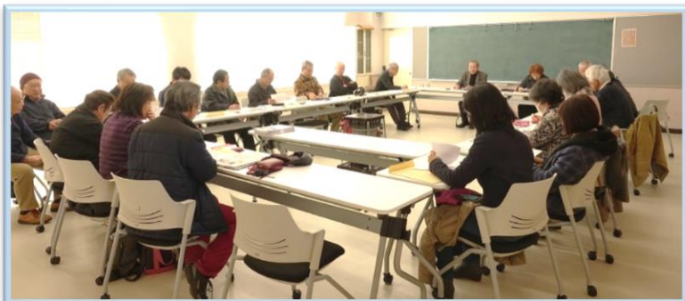
りぼーるたなか (家庭科室)